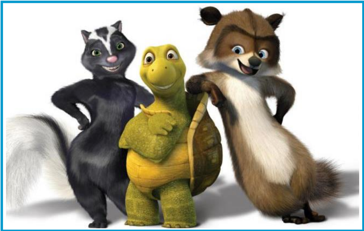
© aus dem Film „Ab durch die Hecke“